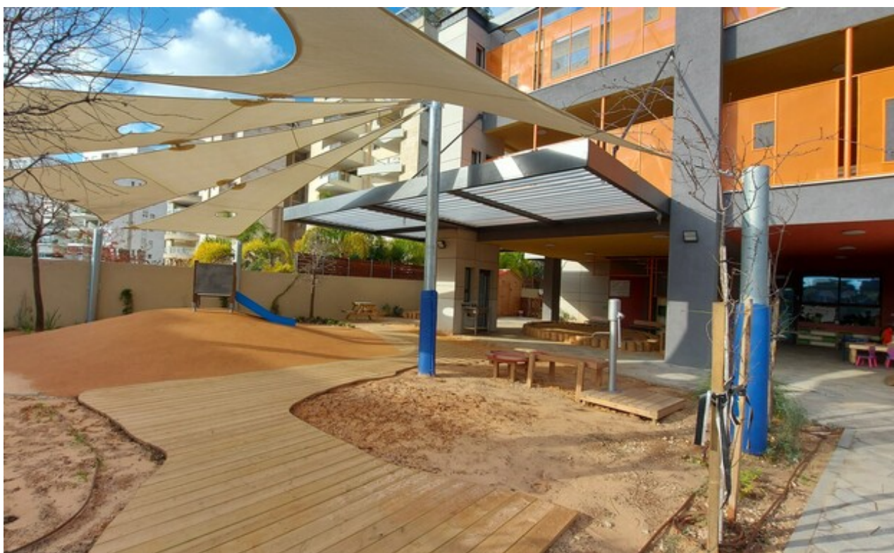
צילום: אקו אדריכלים