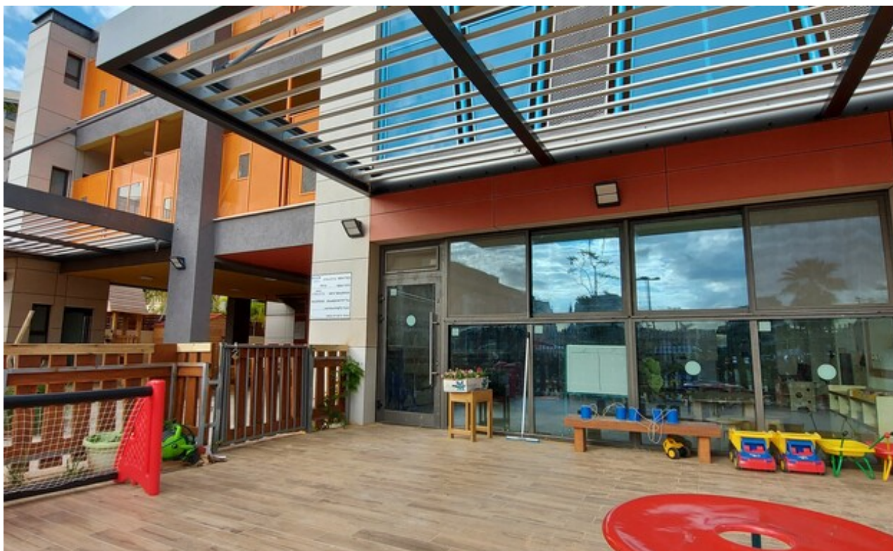
צילום: אקו אדריכלים