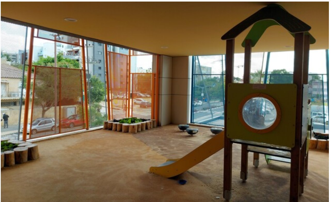
צילום: אקו אדריכלים