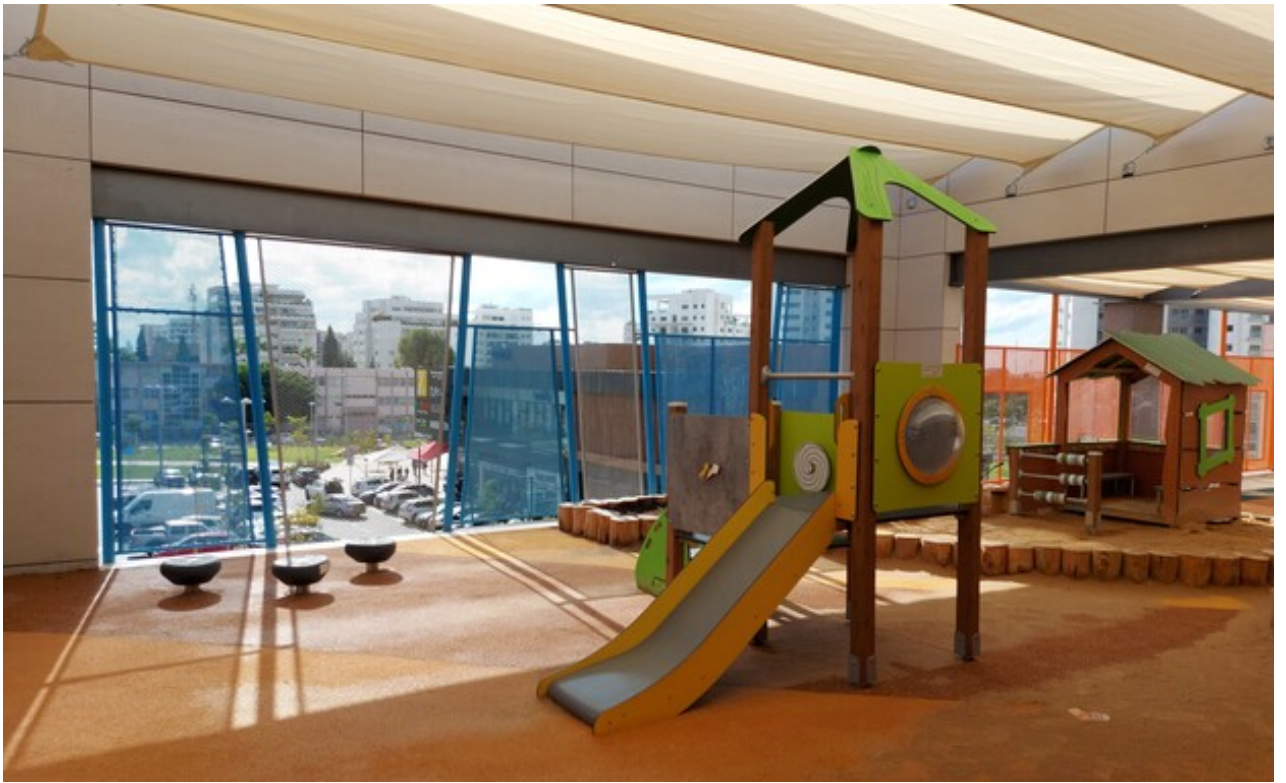
צילום: אקו אדריכלים