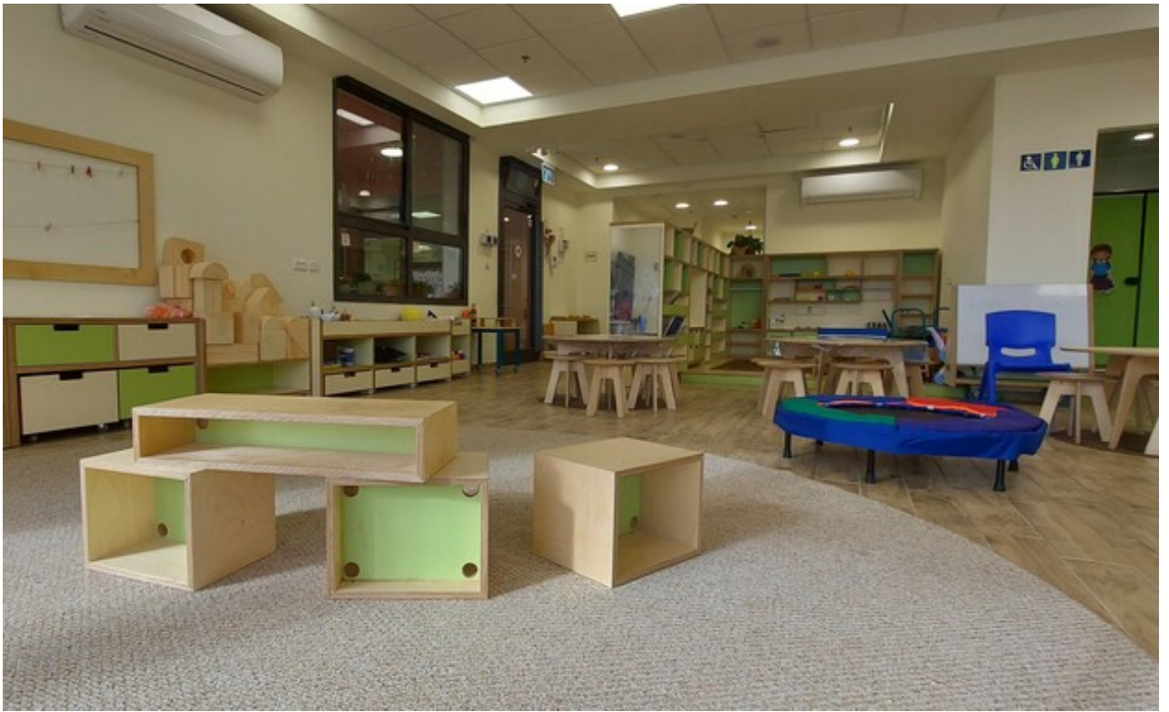
צילום: אקו אדריכלים