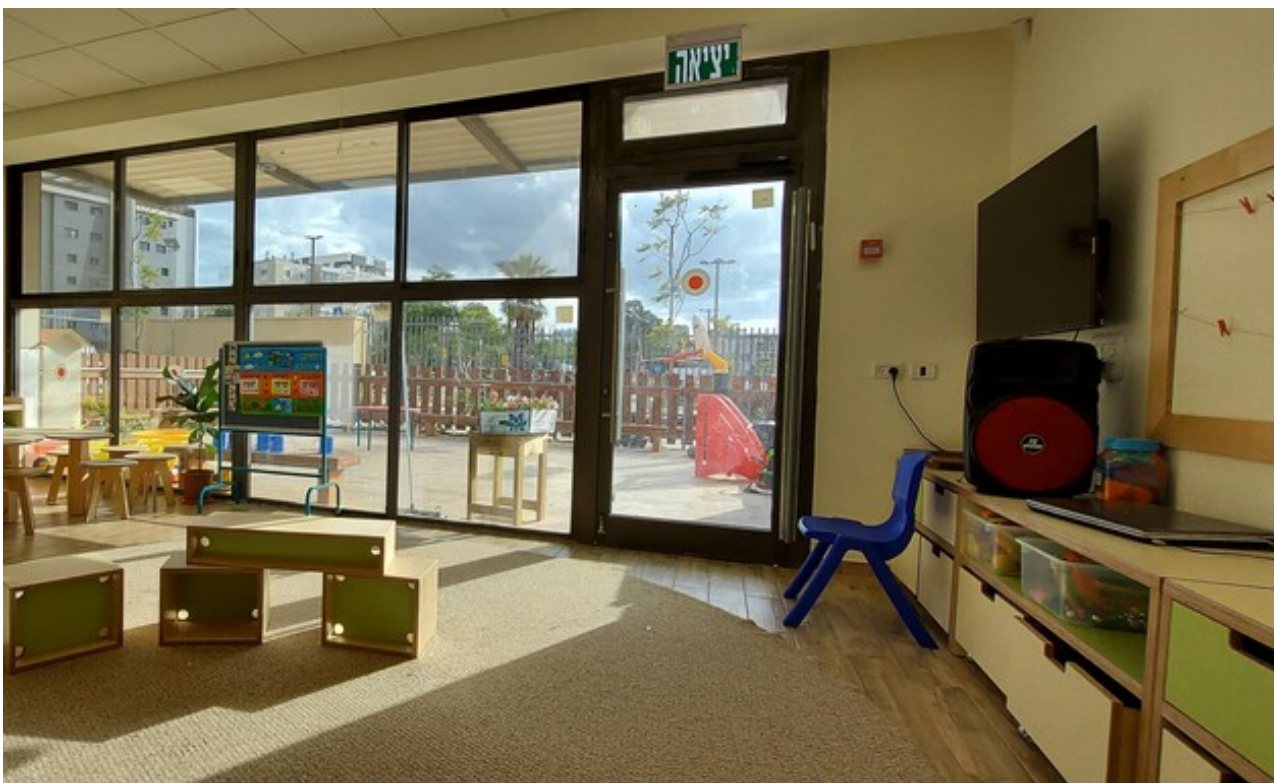
צילום: אקו אדריכלים

<< רוצים עוד? עשו לייק ל-living בפייסבוק