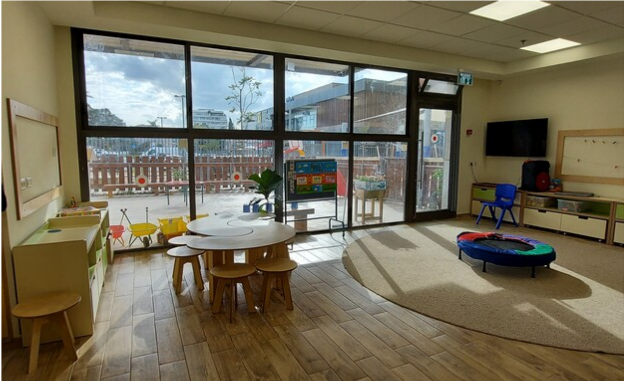
צילום: אקו אדריכלים

בבניין יש גם מעלית, ולקומות העליונות יש כניסה נפרדת, כך שבעתיד יוכלו לשמש לצרכים ציבוריים אחרים, כמו מרכז קהילתי, מועדון יום למבוגרים וכדומה.