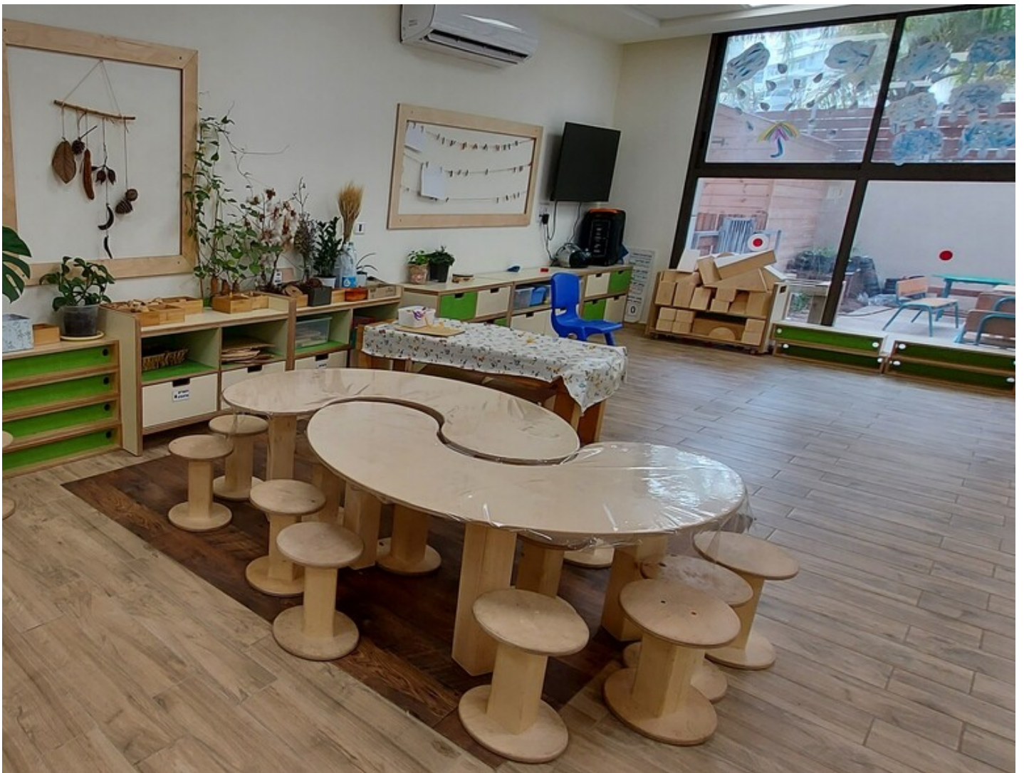
צילום: אקו אדריכלים

יוליה פריליק-ניב, LIVING | LIVING | פורסם 09/02/22 07:00