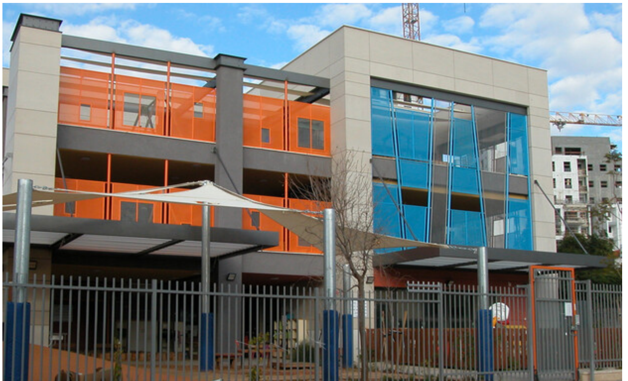
צילום: אקו אדריכלים