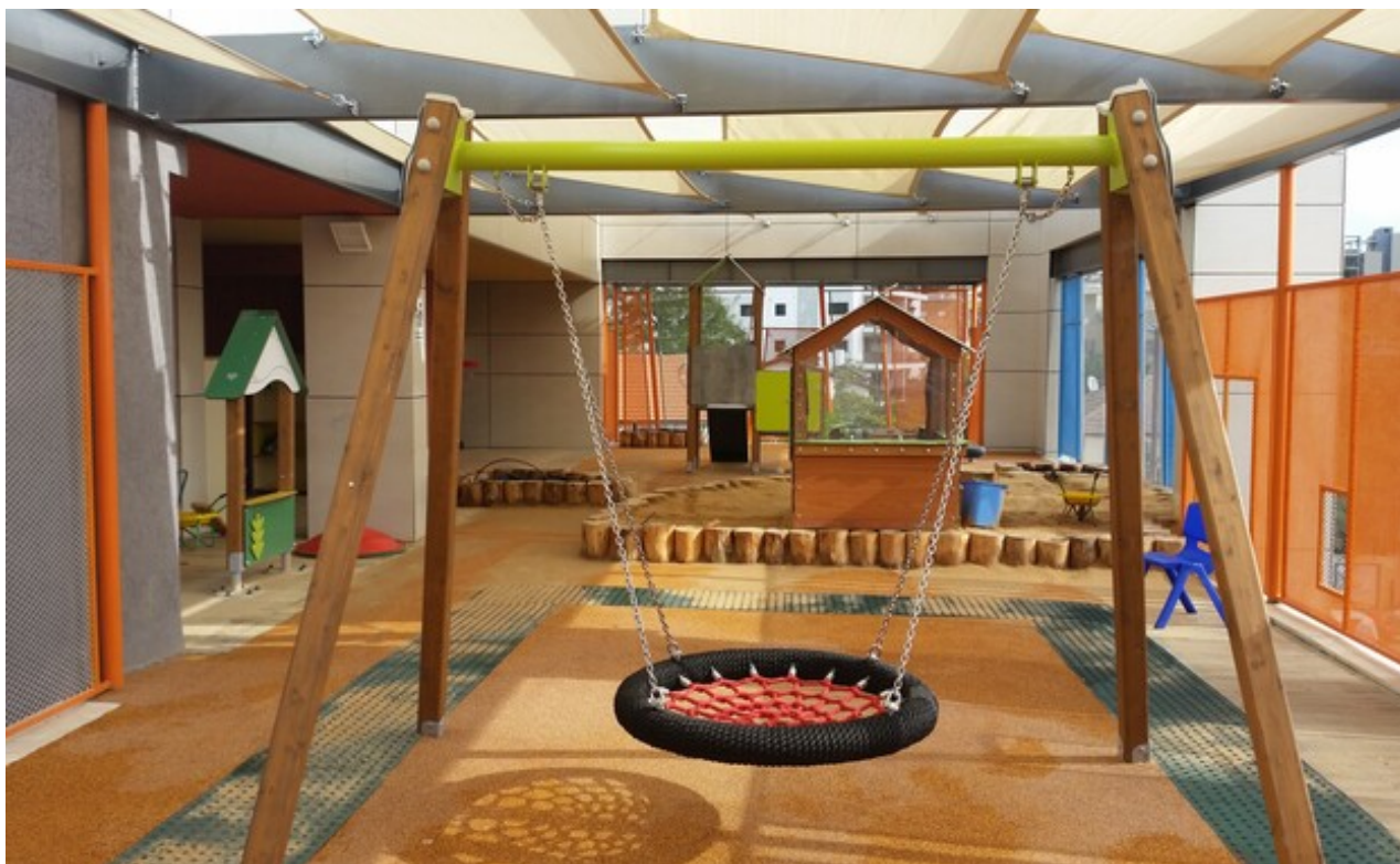
צילום: אקו אדריכלים